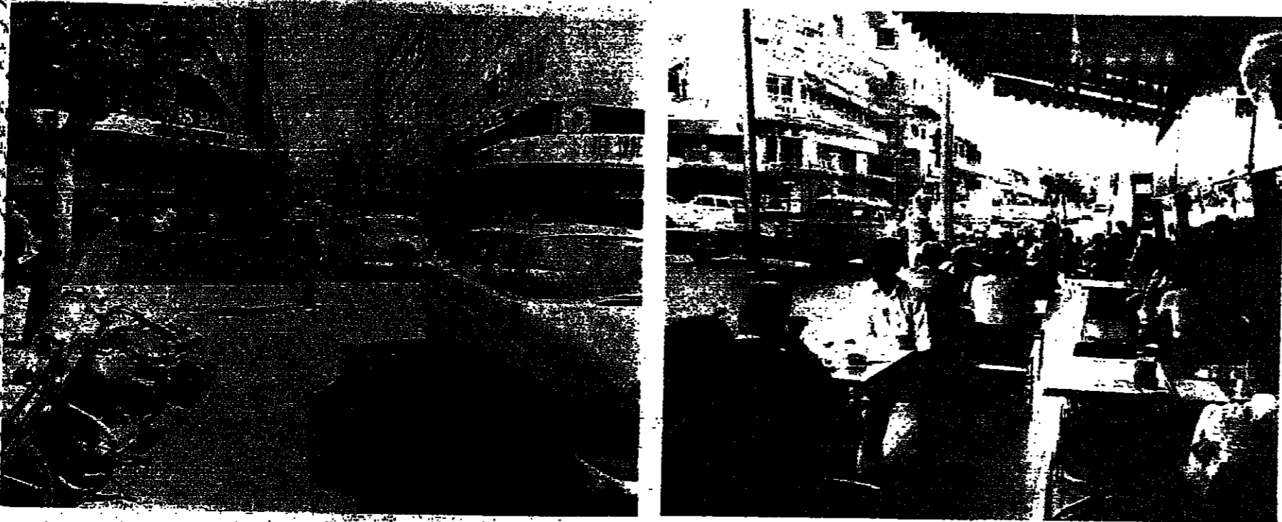
حياة شبه علمية في مقاهي الحمراء وشوارعها